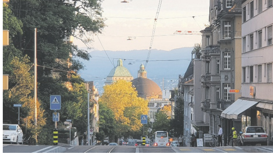
Der QV Oberstrass feiert Geburtstag, unter anderem am 18. März.

Die Probleme änderten sich, aber der Quartierverein funktioniert bis heute nach dem Prinzip, dass Bürgerinnen und Bürger sich auf der untersten Stufe selbst organisieren und ihre Geschicke in die